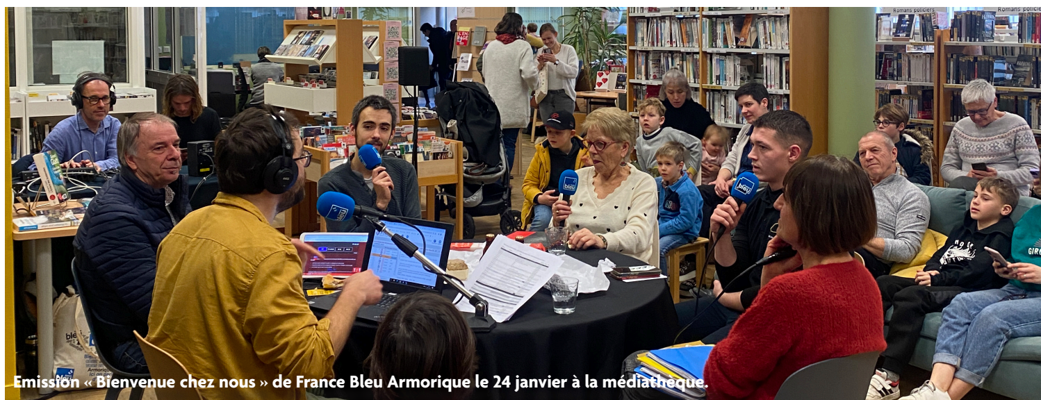
Emission « Bienvenue chez nous » de France Bleu Armorique le 24 janvier à la médiathèque.