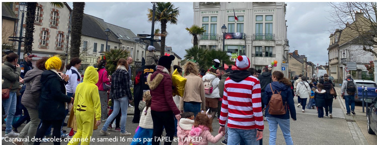
Carnaval des écoles organisé le samedi 16 mars par l'APEL et l'APEEP.